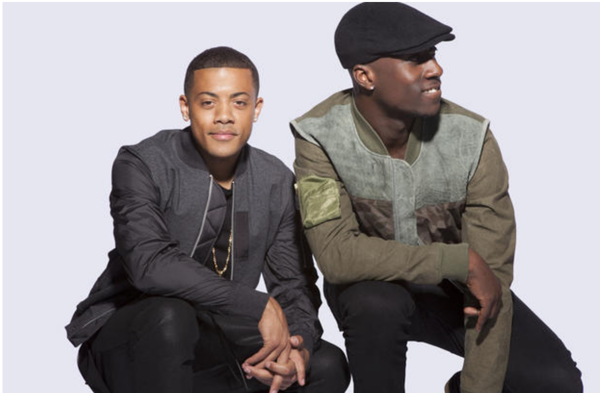
Nico & Vinz