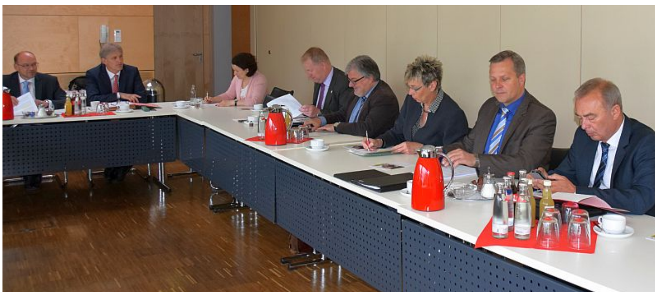
NRW-Minister Rainer Schmelzer (links) war zu Gast in der

Die Integration von Flüchtlingen war ein zentrales Thema der Bürgermeisterkonferenz am Mittwoch im Kreishaus in Unna. Rainer Schmelzer, NRW-Minister für Arbeit, Soziales und Integration, stellte der Runde die Pläne der Landesregierung vor, um die neu angekommenen Menschen möglichst schnell in die Gesellschaft aufzunehmen.