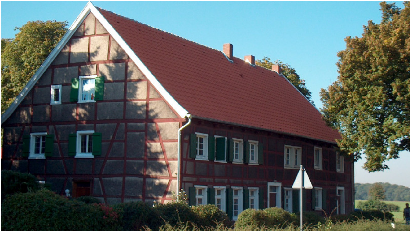
Fachwerkhaus Goekenheide 6 in Weddinghofen.

Nach mehr als 10 Jahren hat die Untere Denkmalbehörde der Stadt Bergkamen erstmals wieder Maßnahmen an Baudenkmalern im Rahmen der Pauschalförderung finanziell gefördert. Möglich wurde dies durch eine finanzielle Unterstützung des Landes NRW in Höhe von 8.000 Euro und einen Anteil der Stadt in gleicher Höhe. Die Förderung dient kleineren Maßnahmen an privaten Baudenkmalern, die dem Erhalt des Denkmals dienen.