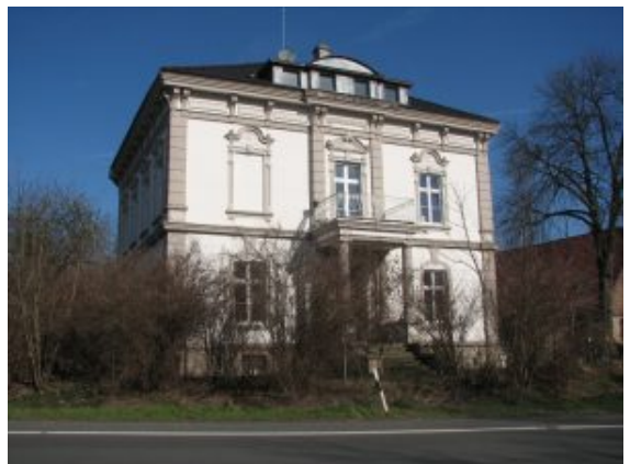
Haus Rünthe, Ostenhellweg 47

Ferner wird Haus Rünthe, Ostenhellweg 47, eine repräsentative Villa aus der Epoche des Historismus von 1900, gefördert. Hier werden die Holzfenster des historischen Wintergartens aus der Entstehungszeit der Villa denkmalgerecht erneuert.