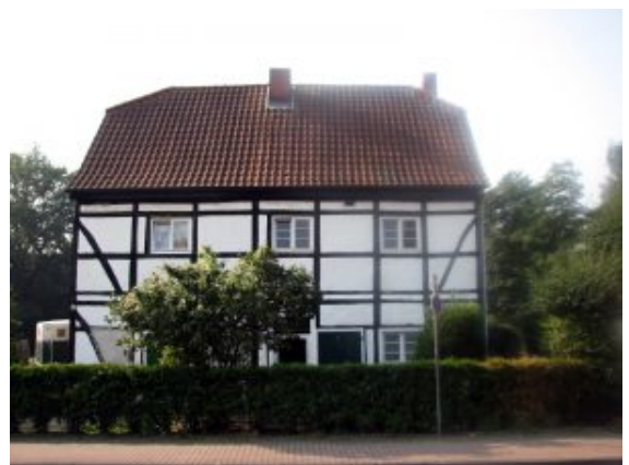
Fachwerkhaus Rotherbachstraße 157 in Oberaden

Nach mehr als 10 Jahren hat die Untere Denkmalbehörde der Stadt Bergkamen erstmals wieder Maßnahmen an Baudenkmalern im Rahmen der Pauschalförderung finanziell gefördert. Möglich wurde dies durch eine finanzielle Unterstützung des Landes NRW in Höhe von 8.000 Euro und einen Anteil der Stadt in gleicher Höhe. Die Förderung dient kleineren Maßnahmen an privaten Baudenkmalern, die dem Erhalt des Denkmals dienen.