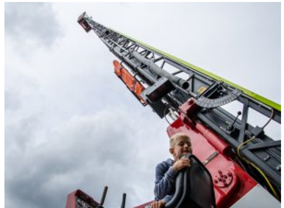
Ungewohnte Perspektiven auf der Drehleiter der Werksfeuerwehr.

Erst waren noch kleine Transporter unterwegs. Dann machten sich ganze Busse auf den Weg, um die vielen Besucher zu den nächsten Stationen zu bringen. Auch die Werkstätten waren geöffnet und erlaubten spannende Einblicke in den Arbeitsalltag. Hier sind die Mitarbeiter mit virtuellen Brillen unterwegs, die ihnen jeden Arbeitsschritt digital exakt vorgeben. Hunderte verschiedener Pumpen, Motoren und Ventile, Kalibrierung, Prozessanalysetechnik: Hier ist echtes Fachwissen gefragt, um den Betrieb am Laufen zu halten und Fehler zu beheben.