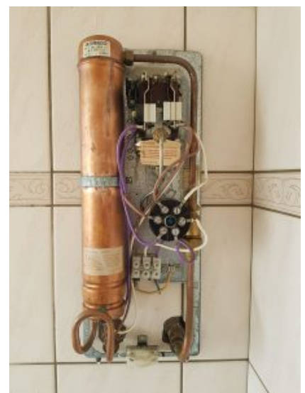
Der defekte Durchlauferhitzer.