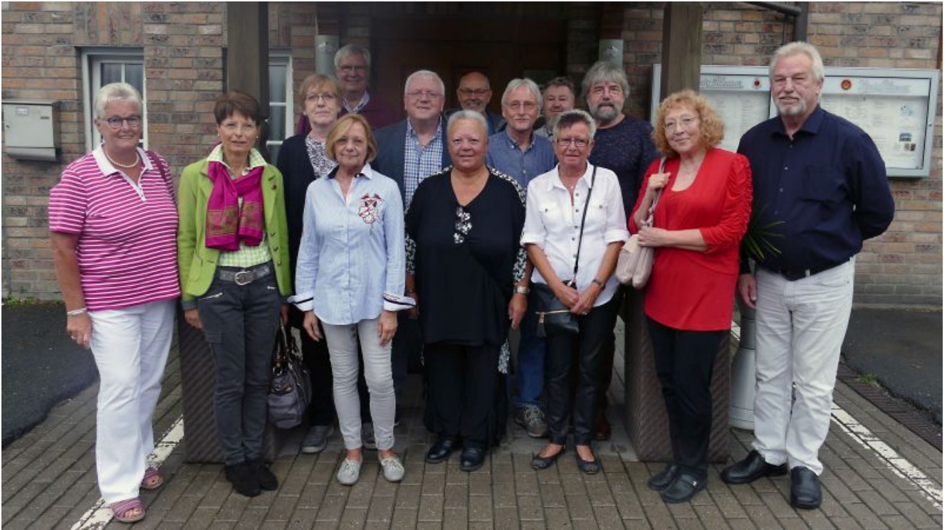
Die Ehemaligen des Entlassjahrgangs 1968 der Pfalzschule Weddinghofen.

Ein fröhliches Wiedersehen gab es am Samstag im Forellenhof für 14 Ehemalige des Entlassjahrgangs 1968 der Pfalzschule Weddinghofen. Zuletzt hatte man sich vor 25 Jahren wiedergesehen. Damals noch in der Gaststätte „Zum schrägen Otto“. Für dieses Klassentreffen nach 50 Jahren hatte einige Ex-Schülerinnen und Ex-Schüler weite Reisen in Kauf genommen, aus Lübeck beispielsweise oder aus dem Frankfurter Raum.