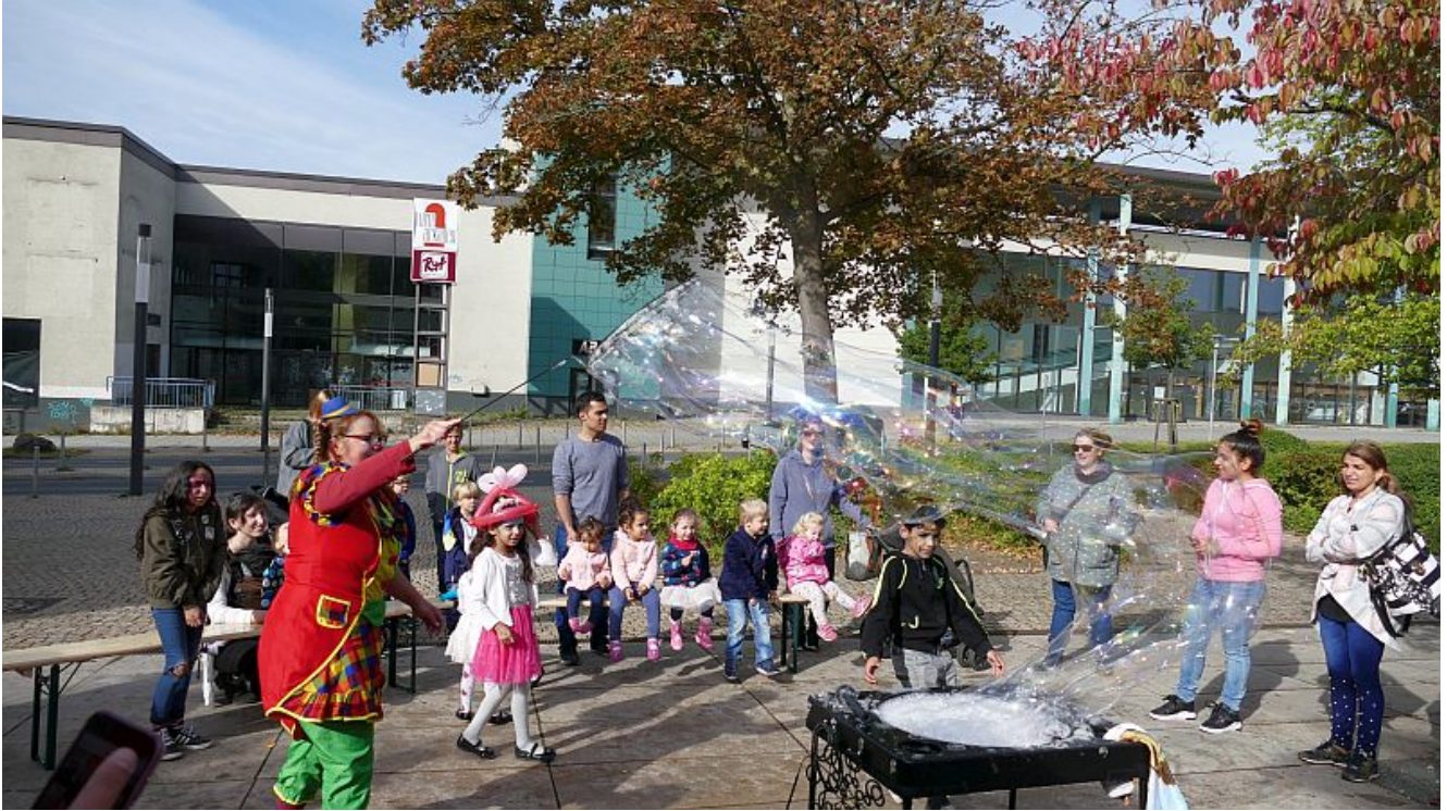
Clownin mit Riesenseifenblase.

Das Bergkamener Kinderfest zum Weltkindertag fiel am Samstag auf dem Platz der Partnerstädte etwa kleiner aus als in den vergangenen Jahren. Ursprünglich sollte es sogar ganz abgesagt werden wegen krankheitsbedingter personeller Engpässe. Hier sind jetzt die Bergkamener Kindertageseinrichtungen der AWO in die Bresche gesprungen.