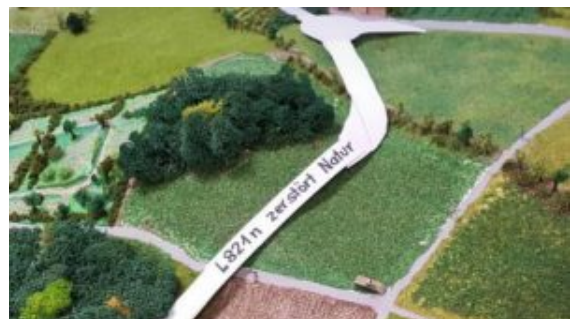
Ausschnitt aus dem Flyer der „BI L821n NEIN“.

Die „BI L821n NEIN“ ruft alle Gegner diese umstrittenen