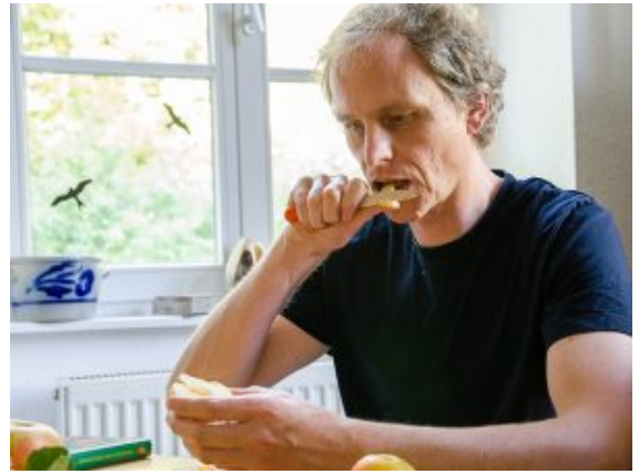
Einer der Pomologen bei der schmackhaften Arbeit.