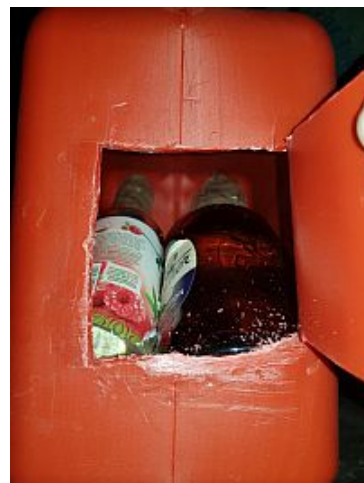
Glasflaschen mit flüssigem Amphetamin im Kanister.

Die Beamten der Kontrolleinheit Verkehrswege des Hauptzollamts Dortmund kontrollierten am 14. November gegen 19.00 Uhr einen Pkw mit polnischer Zulassung in der Anschlussstelle „Dortmund Lanstrop“. Der Wagen wurde auf der A 2 in Fahrtrichtung Hannover aus dem fließenden Verkehr gezogen.