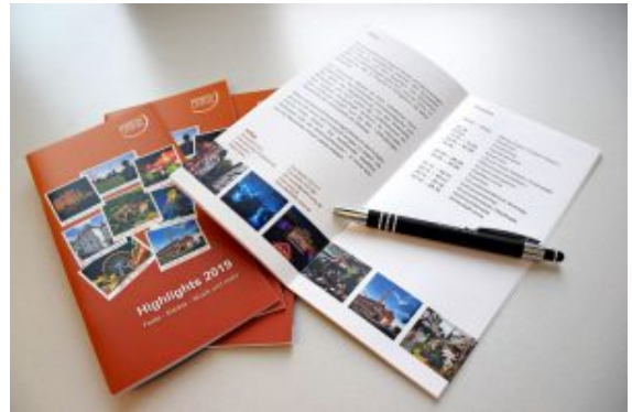
Die „Highlights 2019“.

Die „Highlights 2019“ für den Kreis Unna sind druckfrisch auf dem Markt. Die in Zusammenarbeit mit den Städten und Gemeinden entstandene Broschüre weist auf beliebte Veranstaltungen und überregional beachtete Events hin.