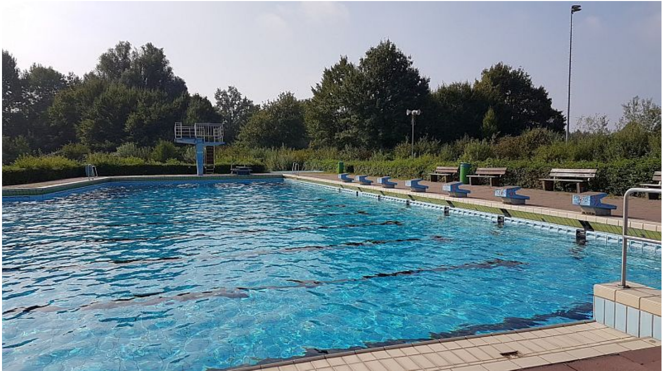
Sportbecken des Wellenbads in Weddinghofen.

Das Wellenbad in Weddinghofen wird aller Wahrscheinlichkeit nach noch ein Mal in eine Freibad-Saison gehen, weil die Entscheidungsprozesse und Planungen für das neue Kombibad noch in den Anfängen stecken. Der Bergkamener Stadtrat beschäftigt sich in seiner Sitzung am 21. Februar mit nur einer Frage: Wer wird das neue Kombibad am Häupenweg bauen?