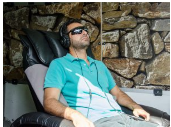
Entspannung im Massagesessel.