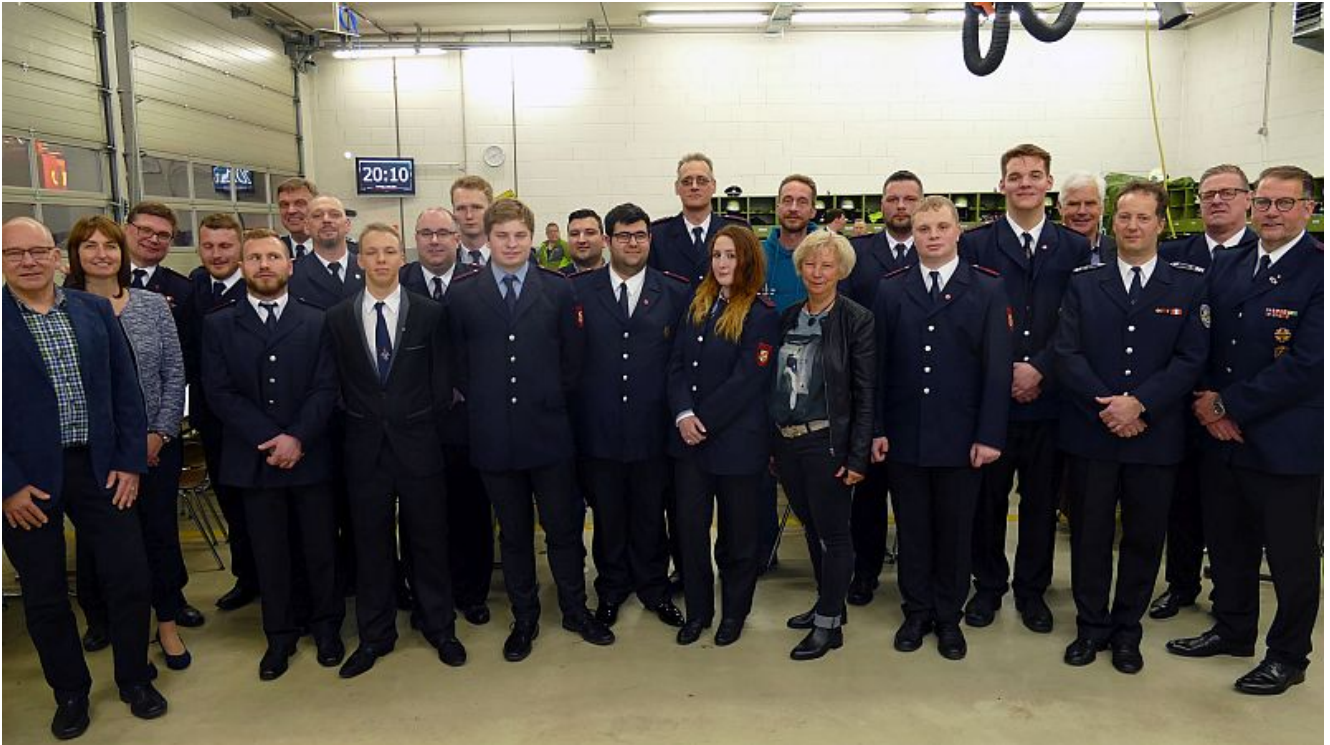
Die Geehrten und Beförderten der Einheit Weddinghofen.