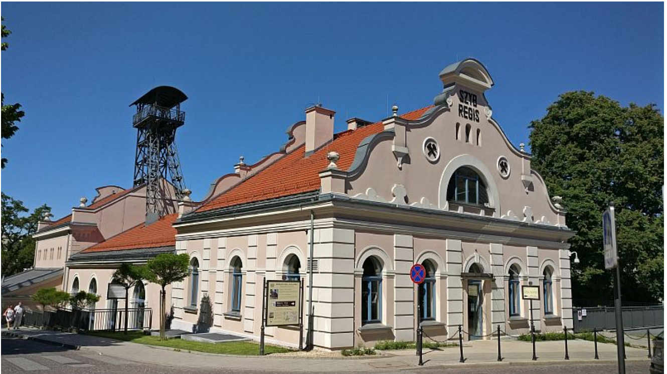
Die Salzmine in Wieliczka.

In der Reihenfolge der Bürgerreisen steht in diesem Jahr als Ziel die polnische Partnerstadt Wieliczka an. Aufgrund von einigen krankheitsbedingten Ausfällen, sind für die Bürgerreise nach Polen noch einige Plätze frei geworden. Die Bürgereise ist vom 04. Oktober bis zum 7. Oktober 2024.