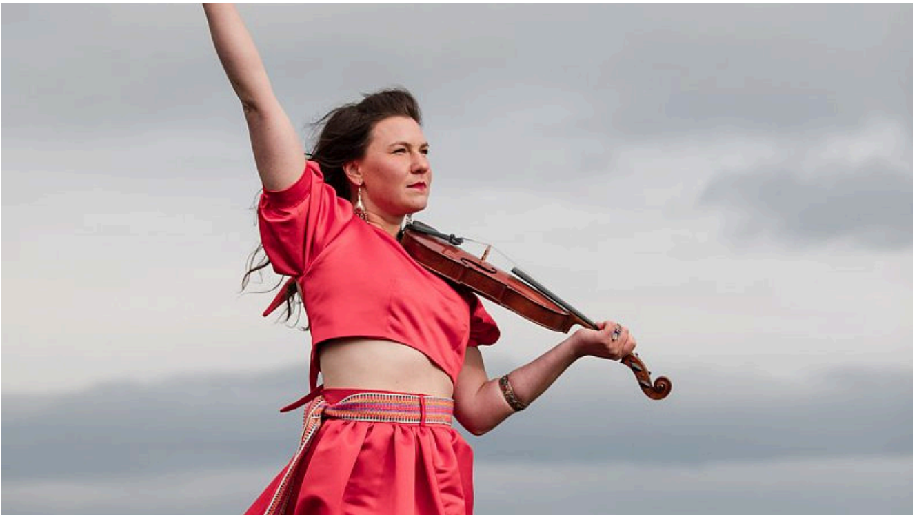
Clare Sands.

Die Veranstaltungsreihe „Klangkosmos Weltmusik“ geht in eine neue Auflage: Zu sechs Konzerten lädt das Kulturreferat Bergkamen auch in dieser Saison ein. Kraftvoll wird es zum Auftakt am 16. September um 20.00 Uhr im Trauzimmer Marina Rünthe werden: Clare Sands ist eine leidenschaftliche Künstlerin, die einen einzigartigen Stil repräsentiert. Sie erzeugt energische und eklektische Klänge, die in der traditionellen irischen Musik verwurzelt sind.