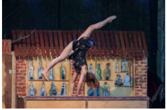
Kabaret K.

Humor. Das Publikum wird von berauscher Artistik und knalligen Balkan-Beats mitgerissen. Eine anarchistische Show, eine phantastische Mixtur direkt aus dem Berliner Underground! Die Veranstaltung ist kostenlos. Einlass ist ab 18 Uhr.