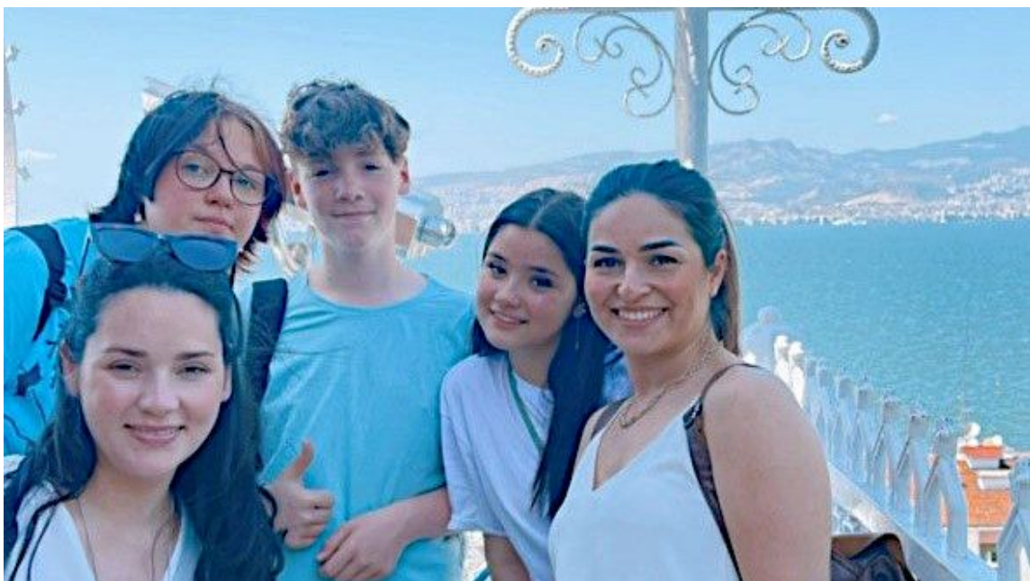
Bergkamener Gesamtschüler in Izmir.

Im November 2022 unternahmen Schülerinnen und Schüler der Jahrgänge 8 und 9 der Willy-Brandt-Gesamtschule in Begleitung der Lehrerinnen Frau SaefteI und Frau Wiemhoff die 4. Reise im Rahmen des Erasmus-Projekts „Think sustainable, act responsible“ nach Palermo/Italien.