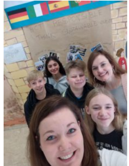
... und in Palermo.

Im Fokus stand das Thema „Nachhaltiger Umgang mit Wasser“. Als gemeinsame Aktion präsentierten alle Ländergruppen Materialien zum Wasserverbrauch verschiedener Gegenstände des alltäglichen Lebens (z. B. Früchte oder Kleidungsstücke), des Weiteren wurden eine Salzmühle am Meer besucht sowie Wasserproben zur Bestimmung der Wasserqualität entnommen und untersucht.