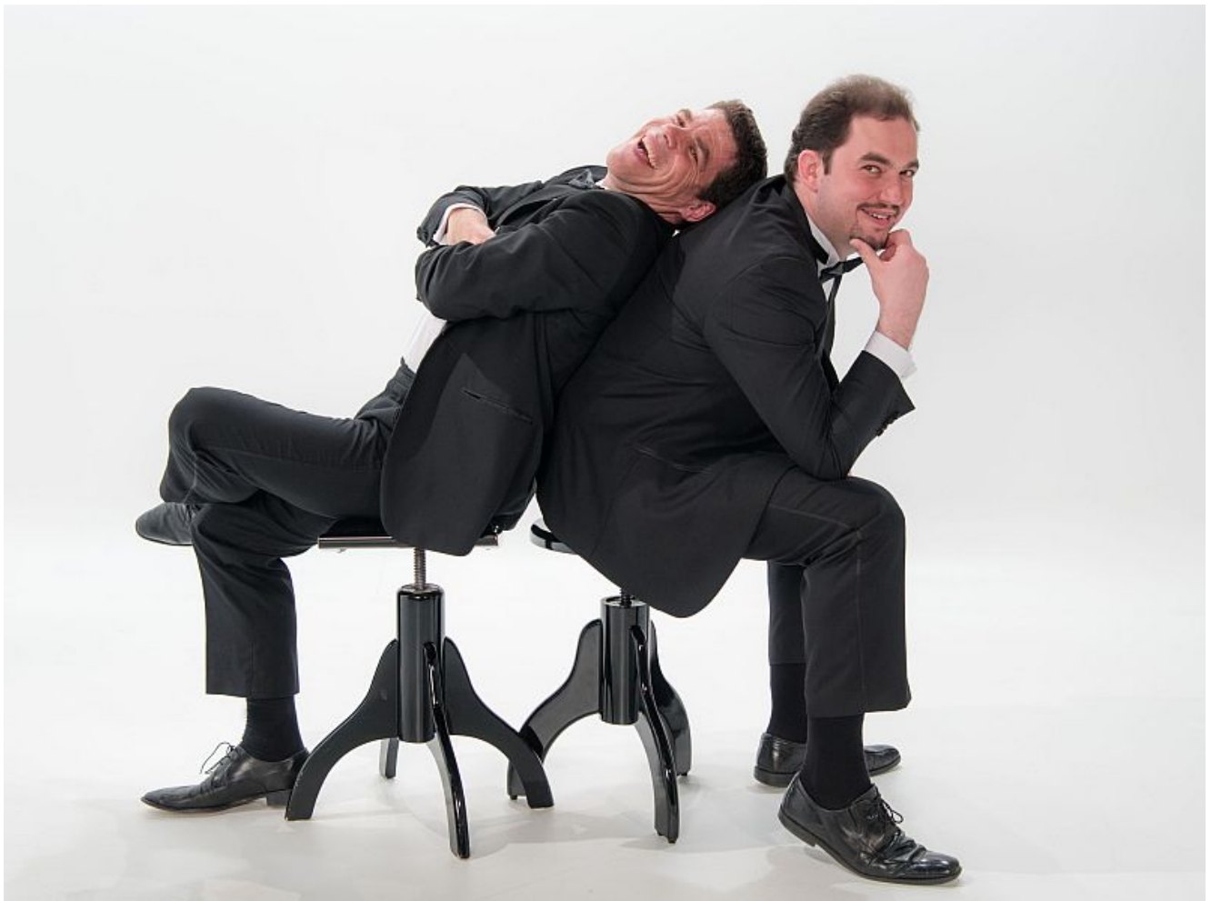
Das Duo Notenlos.

Die Künstler Pusch & Speckmann geben die „Living Jukebox“ und präsentieren ein Wunschkonzert der Extraklasse, das man so noch nie gehört hat – und das auch jedes Mal anders klingt.