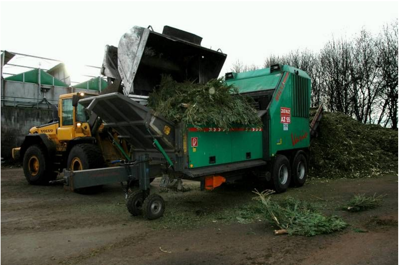
Schredderanlage in Ostbüren.

In diesen Tagen werden die Weihnachtsbäume abgeschmückt und zur Abholung an die Straße gelegt. Die konkreten Abholtermine sind in den einzelnen kreisangehörigen Städten und Gemeinden unterschiedlich und dem jeweiligen Abfallkalender und der Tagespresse zu entnehmen. Die GWA-Abfallberatung weist darauf hin, dass die Bäume am Abholtag spätestens ab 6 Uhr morgens gut sichtbar und ohne Baumschmuck bereit liegen müssen.