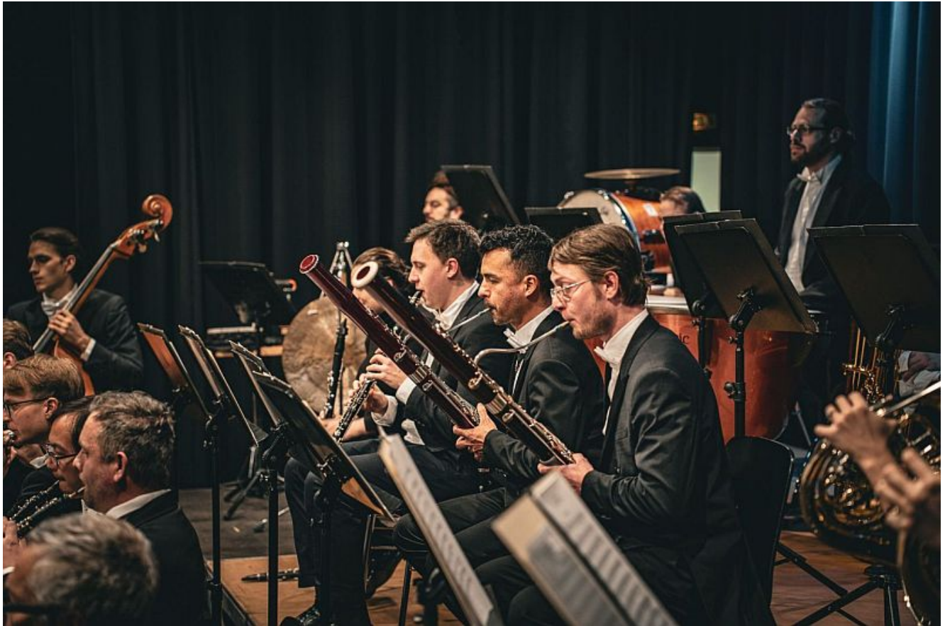
Festliche Silvesterkonzert mit der festival:philharmonie westfalen.

Gute Vorsätze müssen nicht anstrengend sein, sie können auch Spaß machen. Wer im neuen Jahr mehr lachen, staunen und Neues erleben möchte, findet im Bergkamener Kulturprogramm zahlreiche Anregungen. Das Kulturreferat der Stadt Bergkamen lädt dazu ein, mit Kultur, Humor und Musik beschwingt ins Jahr zu starten und dabei ganz nebenbei die Bauchmuskeln zu trainieren.