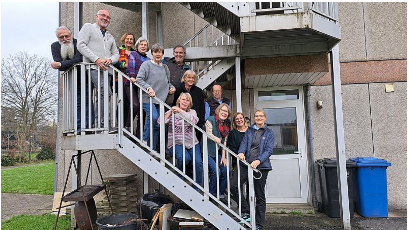
Kunstwerkstatt sohle 1 Bergkamen.