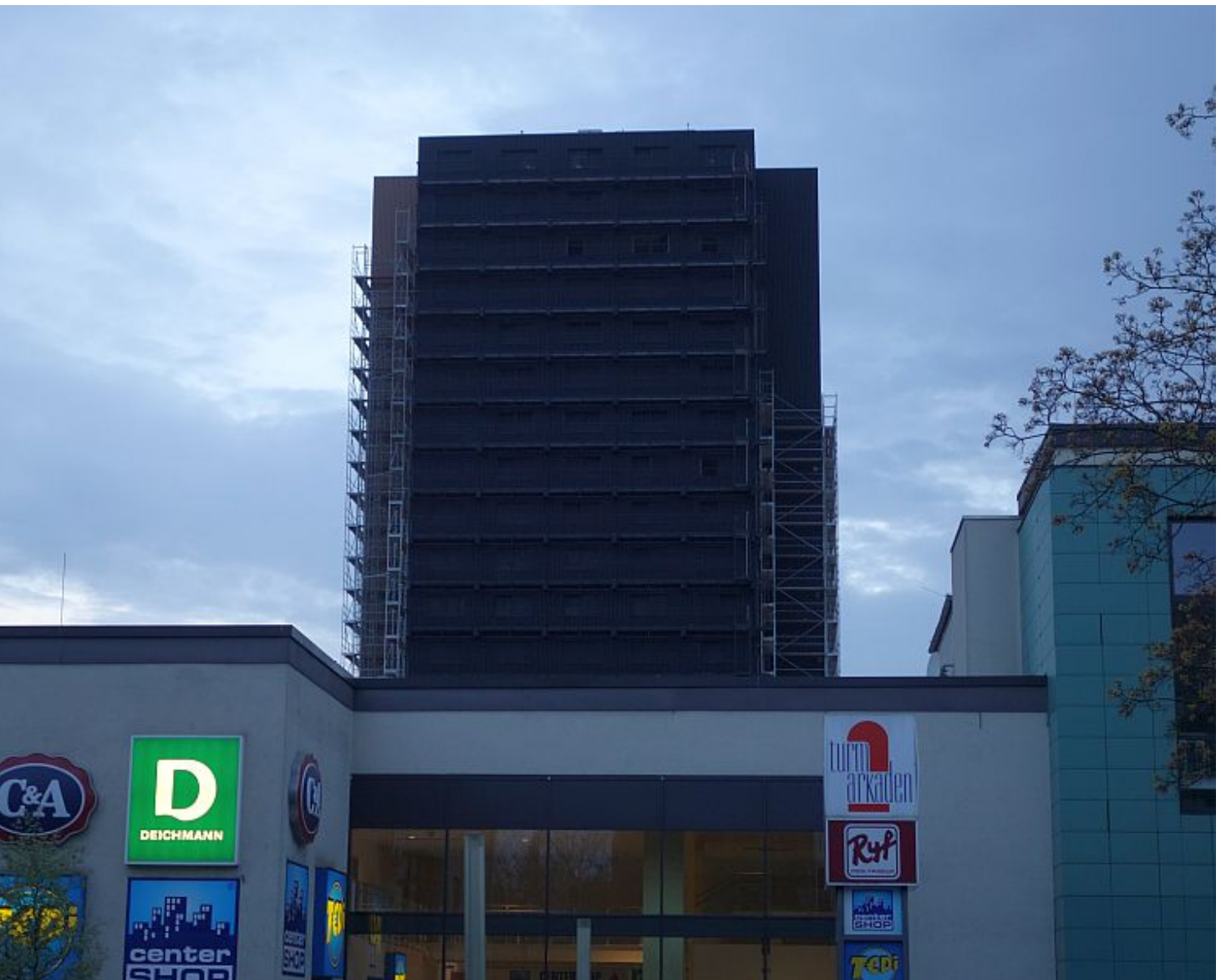
Bergkamener Wohnturm in der Abenddämmerung.