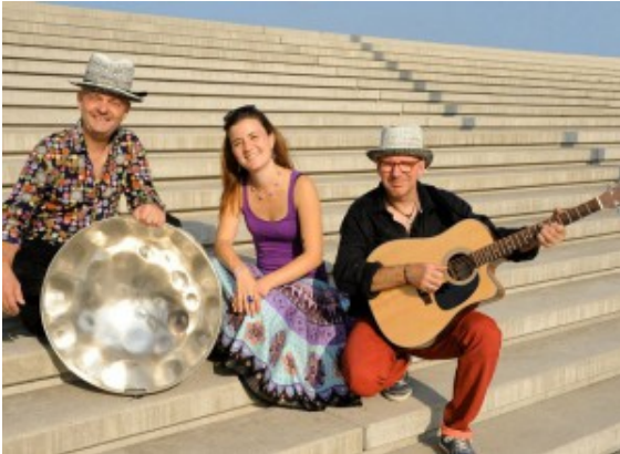
Das Janina Trio

ca. 23.00 Uhr und am Sonntag, 20. Juli von 12.00 bis ca. 18.00 Uhr