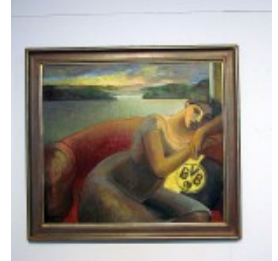
Echte Liebe zum BVB.