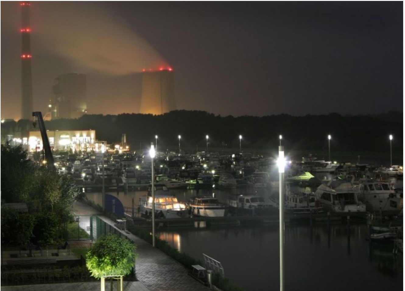
„Marina Pulslicht“ von Mischa Kuball