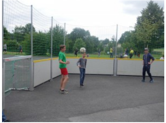
Schulfestangebot: Streetsoccer auf dem Pausenhof

Dass heißt unter anderem, dass von den vier Sportstunden wöchentlich in den Klassen 5 bis 8 zwei dem „Runden Leder“ vorbehalten sind. Dabei wird natürlich nicht einfach gekickt, sondern nach modernen Erkenntnissen trainiert.