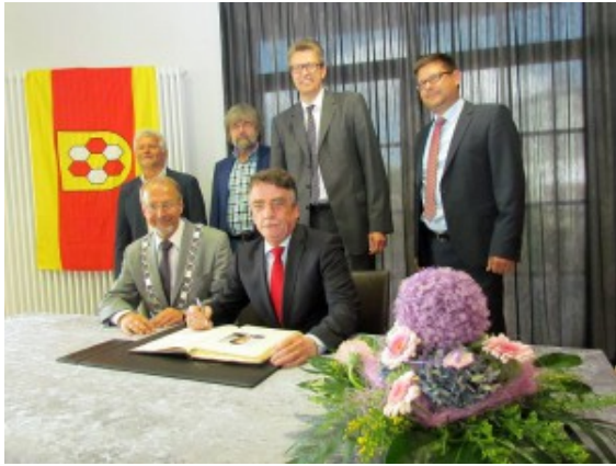
Eintrag ins Goldene Buch der Stadt Bergkamen

Thema waren natürlich die großen Bauprojekte. Dazu gehört natürlich an erster Stelle die Wasserstadt Aden. Hier stellt das Land Fördermittel in Höhe von 10 Millionen Euro zur Verfügung. Groschek ließ sich genau erklären, wie das Geld aus Düsseldorf in Bergkamen verwandt wird.