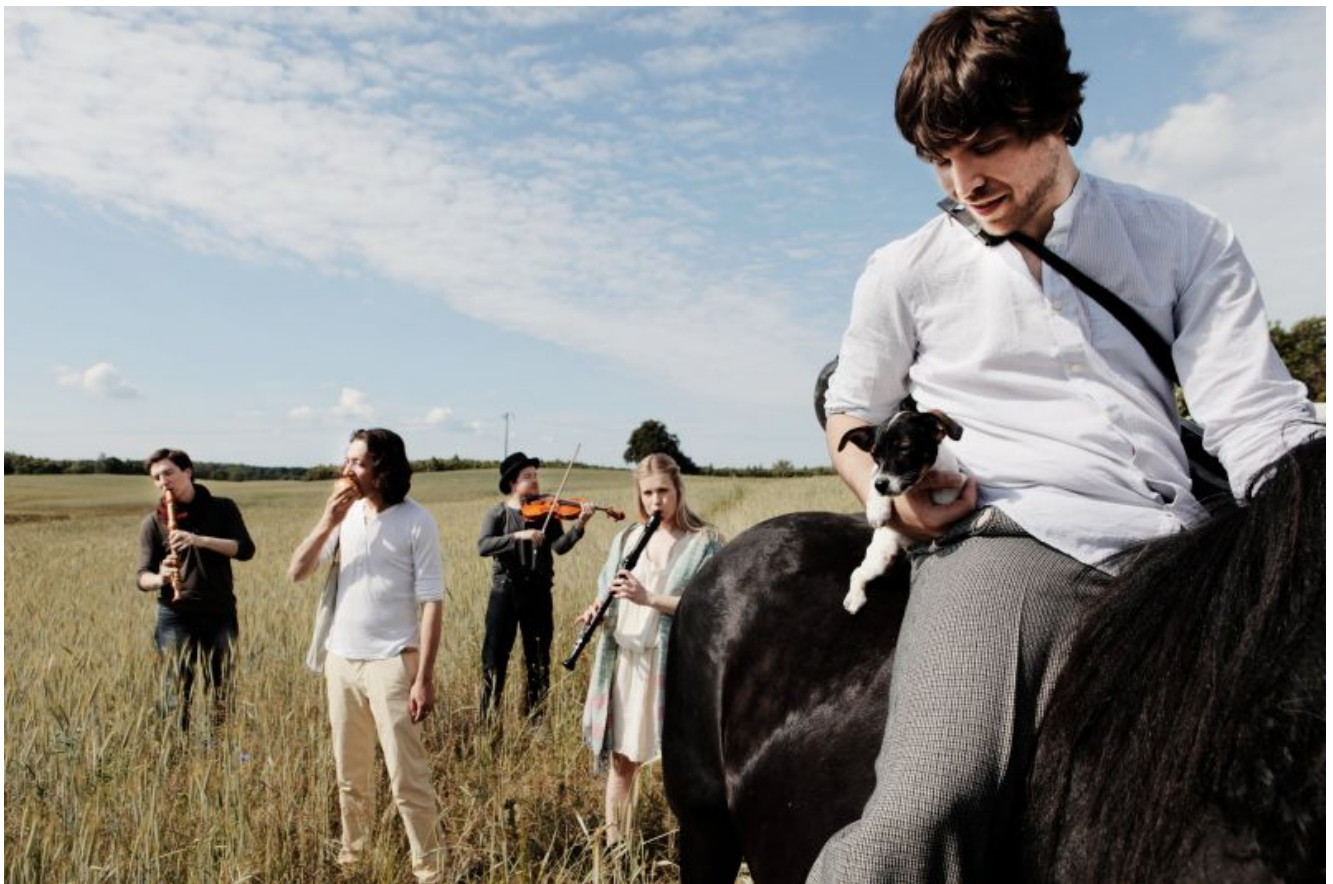
Die Gruppe „Spark“

Ein Klassikkonzert auf höchstem Niveau mit dem hochkarätigen Ensemble „SPARK“ lädt am Freitag, 8. August, um 20 Uhr zu einer außergewöhnlichen Musiknacht auf den Zentrumsplatz ein.