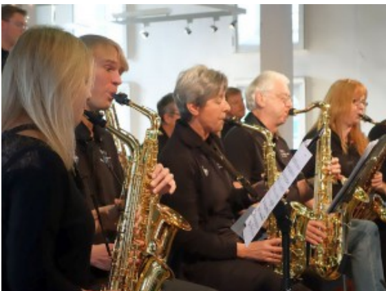
Die Saxophone der Big Band der Musikschule Bergkamen

Das Konzert selbst lässt sich eigentlich kaum mit Worten beschreiben. Das musste man einfach gehört und miterlebt haben. „BOB“ bot Klassik mit Kompositionen von Bizet und Rossini. Dazu von Star Wars bis Forest Gump Klassiker der Filmmusik.