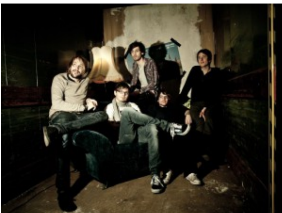
NOTHING BUT RASCALS

Erstmals hatte der Energieversorger DEW21 bei seinem Bandwettbewerb „Dortmund Calling“ auch Teilnehmer aus der Region zugelassen. Drei Bands aus Bergkamen und Kamen haben dabei kräftig abgesahnt und spielen jetzt im Halbfinale.