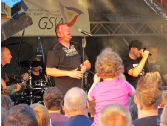
Burning Heart spielen beim Hafenfest 2015.

eine Terminliste mit den größeren städtischen Veranstaltungen in diesem Jahr.