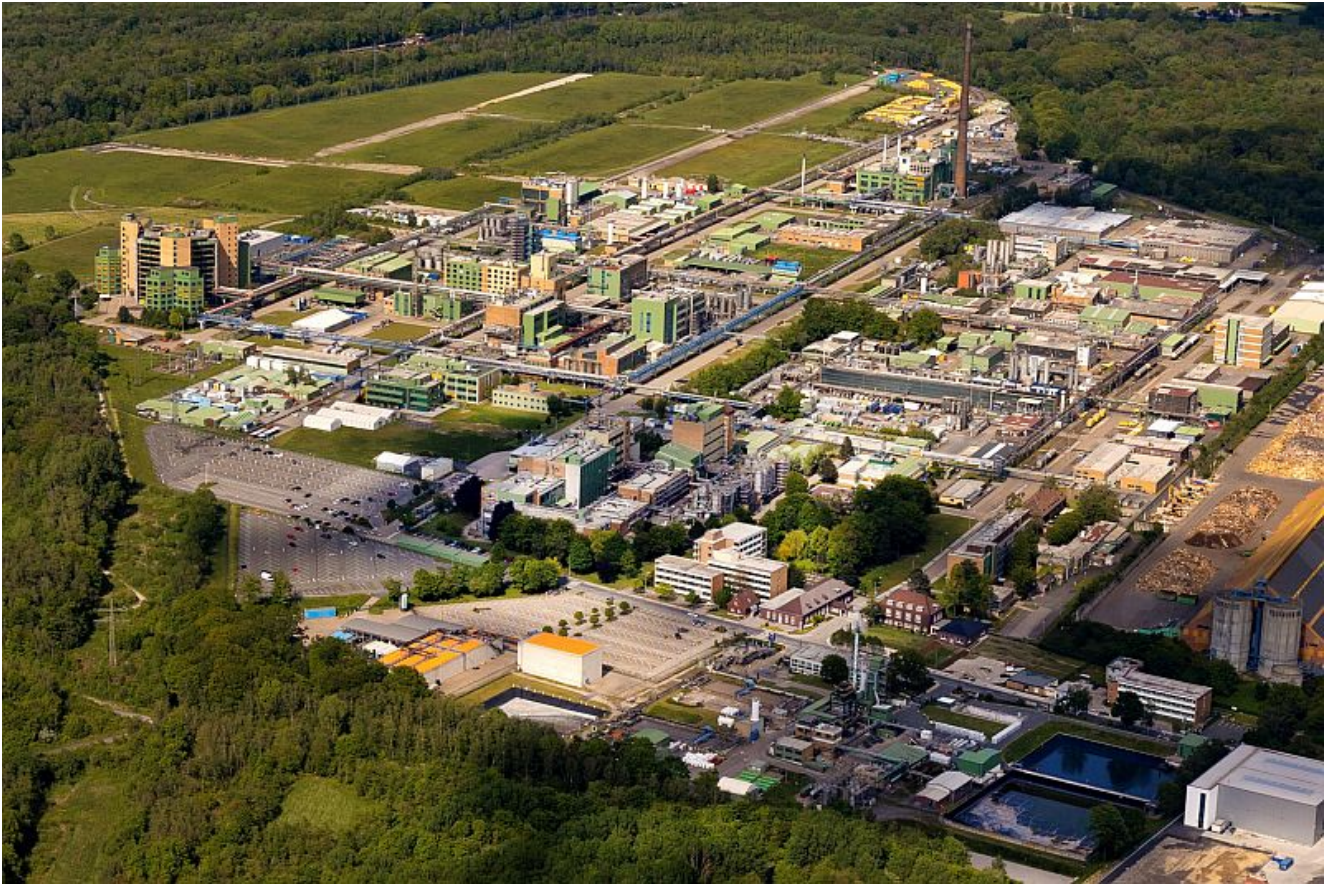
Der Bayer-Standort Bergkamen.

Bayer und E.ON kooperieren am Standort Bergkamen, um bei der nachhaltigen Energieversorgung einen entscheidenden Schritt voranzukommen. E.ON wird in der Zukunft Bayer mit „grünem“ Dampf versorgen, der CO 2 -neutral in seinem in unmittelbarer Nähe zum Industriepark befindlichen Biomasseheizkraftwerk aus Altholz produziert wird.