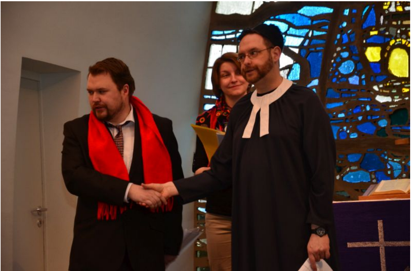
Probenszene aus „Donnerhall und Glockenläuten“

Die Proben sind abgeschlossen. Alles ist vorbereitet. Alles ist durchorganisiert. Wer jetzt noch einen Platz fürs Theaterdinner am 11. April in der Auferstehungskirche „Donnerhall und Glockenläuten“ (frei nach Don Camillo u. Peppone) buchen möchte, sollte sich zügig melden.