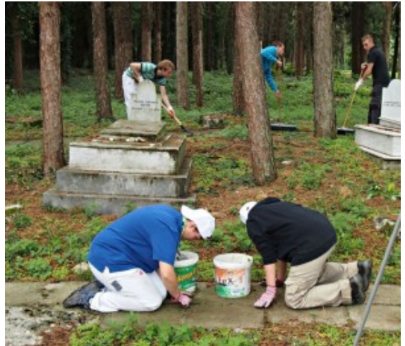
Arbeitseinsatz auf dem Jüdischen Friedhof in Griechenland.

Das Projekt „young workers for europe“ wird vom aktuellen forum nrw e.V. von 2012 bis 2014 durchgeführt. Das aktuelle forum mit Sitz in Gelsenkirchen ist nach dem Weiterbildungsgesetz des Landes NRW anerkannter Träger der demokratischen und politischen Erwachsenenbildung sowie anerkannter Träger der Jugendhilfe.