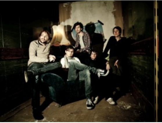
NOTHING BUT RASCALS

Folgende Künstler treten auf: Turnstiles (Alternative & Rock, Bergkamen und Berlin), Nothing but Rascals (Bergkamen und Dortmund – Indierock unplugged), Nazca Lines (die jungen Wilden mit Ambient, Noise, unplugged), Lennart Riedel (Singer-Songwriter aus Bergkamen) & das Spaßprojekt D.K.O.G. (zwei Mal Gitarre und Gesang aus Bergkamen).