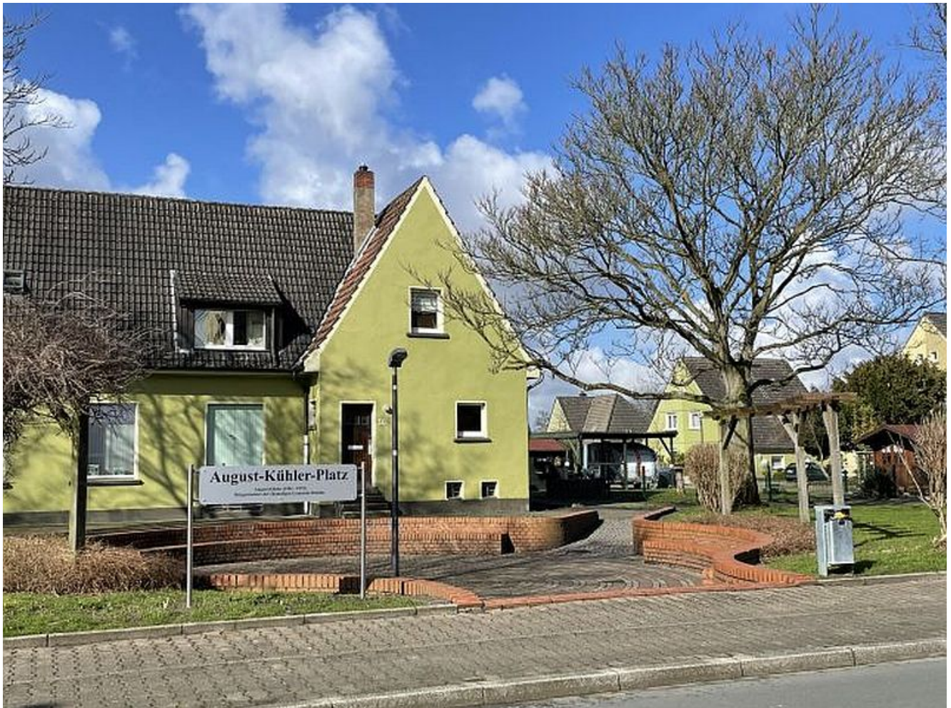
August-Kühler-Platz in Rünthe.

Eine Initiative einiger Rünther Vereine hat sich vorgenommen, öffentliche Plätze in Rünthe zu Treffpunkten für die Rünther Bevölkerung zu machen. Als erstes fiel der August-Kühler-Platz an der Overberger Straße in den Blick. Dieser Platz hatte vor einiger Zeit den Namen des letzten Bürgermeisters von Rünthe erhalten und bietet sich aufgrund seiner Lage und Gestaltung als Treffpunkt für die Anwohner an.