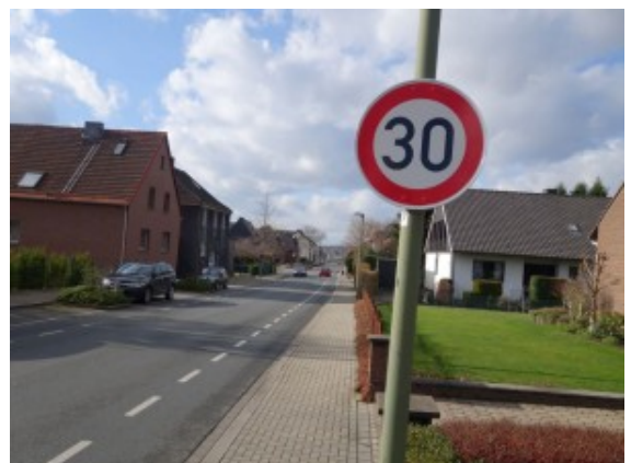
Eins der neuen Tempo 30-Schilder an der Heinrichstraße.

Runter vom Gas wenn es über die Heinrichstraße geht. Nagelneue Tempo 30-Schilder sind dort aufgehängt worden. Wer sie nicht bemerkt, muss mit einem gebührenpflichtigen Foto rechnen.