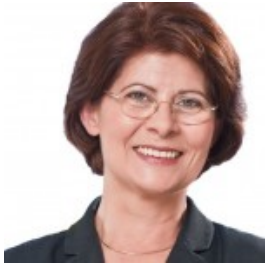
Dr. Renate Sommer

Sie spricht im Hinblick auf die Europawahl am 25.Mai 2014 zu dem Thema: „Die Werte der Europäischen Union“. Die Referentin stellt sich erneut als Spitzenkandidatin für das Ruhrgebiet zur Wahl.