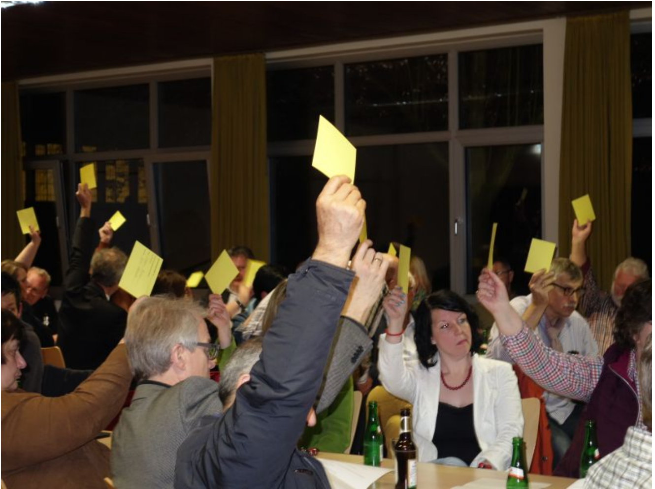
Abstimmung übers Wahlprogramm

Einstimmig hat der SPD-Stadtverband am Donnerstagabend sein Wahlprogramm für die Kommunal- und Bürgermeisterwahl am 25. Mai verabschiedet. Die Sozialdemokraten setzen hier vor allem auf Kontinuität.