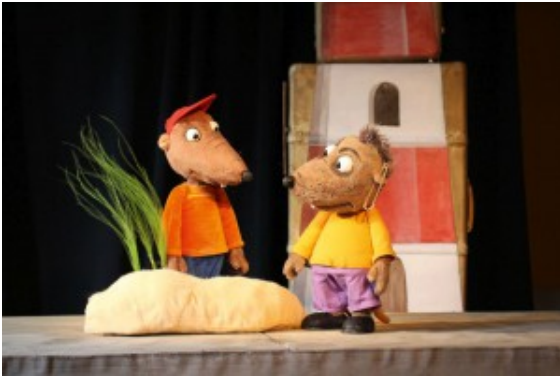
Das Figurentheater Marmelock aus Hannover mit „Eliot und Isabella“