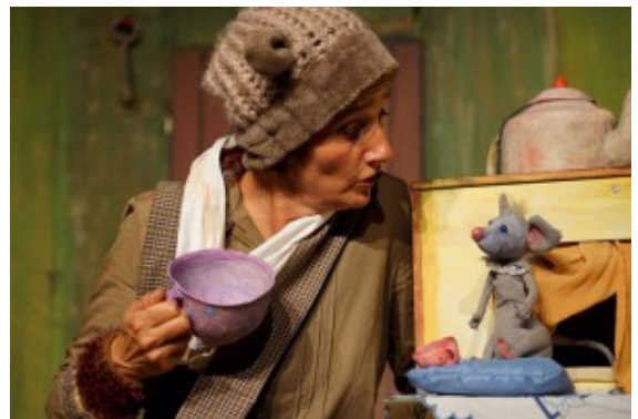
Das Theater Wilde Hummel aus Bochum zeigt „Mausekuss für Bär“