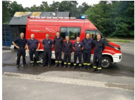
Cobra benötigt als Fahrzeug nur einen Transporter.

Feuerwehr Bergkamen betrieben wird. Beide Wehren hatten sich gemeinsam beworben, mussten sich jedoch für einen Standort entscheiden. Bei jeder Alarmierung fährt die Cobra aus Werne mit einem ELW 1 aus Bergkamen Rünthe zur Einsatzstelle, um insbesondere bei überörtlichen Lagen einen Zeitvorteil zu gewinnen. Das ersteintreffende Fahrzeug übernimmt die Staffelführung und beginnt unmittelbar mit der Erkundung.