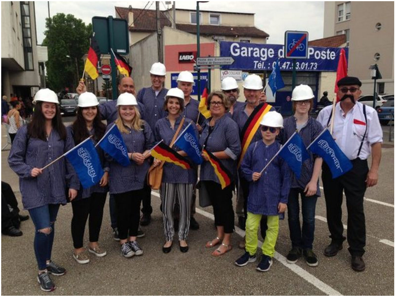
Bergkamener Delegation beim Carnaval in der französischen Partnerstadt Gennevilliers.

Seit Bestehen der langjährigen städtepartnerschaftlichen Beziehungen zur Türkei nutzte die Stadt Bergkamen zum zweiten Mal das Kulturfestival in Silifke, um sich mit einem Informationsstand zu präsentieren. Neben Informationen über die deutsche Partnerstadt, waren auch Waffeln, als „süße Botschafter“ im Angebot.