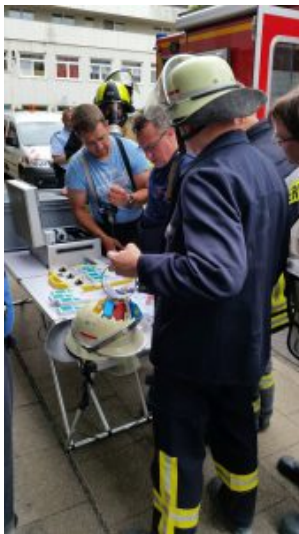
Aufbau der Messstelle. Hier werden gerade die Proberöhrchen zusammenstellt. Damit sind Trupps der Feuerwehr in