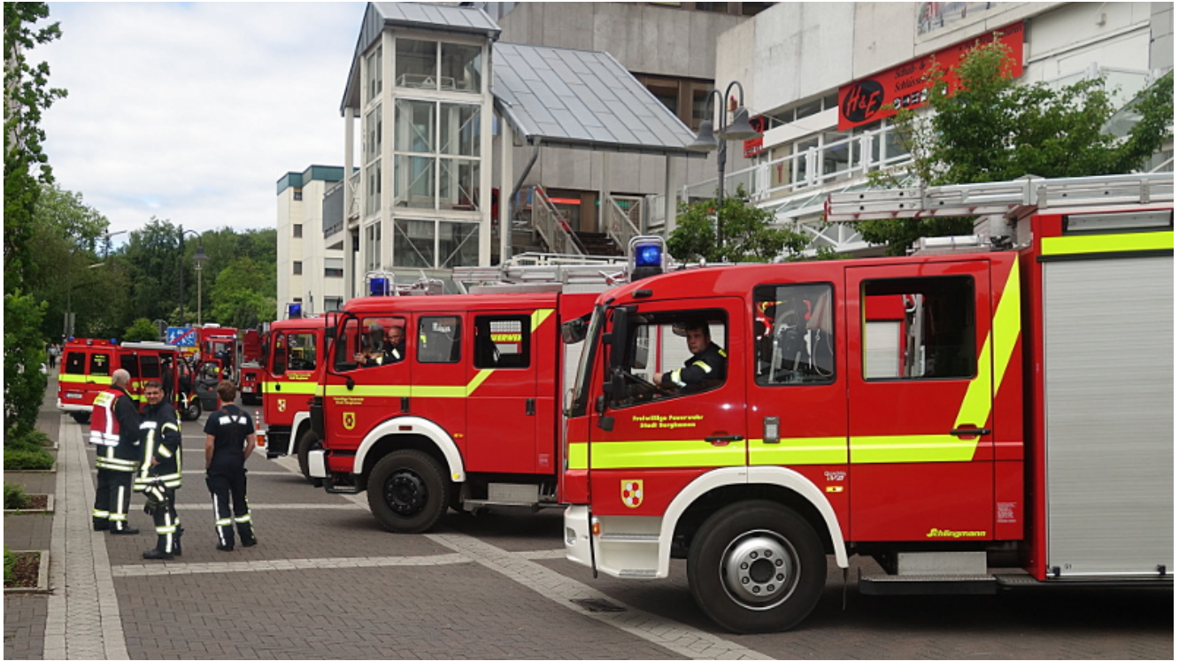
Großeinsatz der Bergkamener Feuerwehr am Dienstagmorgen an und in den Turmarkaden.