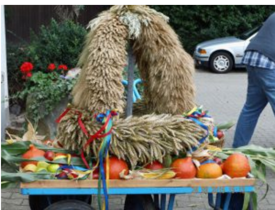
Die Erntekrone.

Der Ev. Männerverein wird in diesem Jahr am Donnerstag, 29. September, einen Umzug durchs „Alte Dorf“ vornehmen, um Erntegaben für die Auferstehungskirche zu sammeln. Beginn ist um 14:15 Uhr in der Kleingartenanlage „Im Krähenwinkel“ an der Töddinghauser Straße.