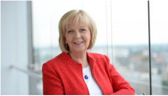
Ministerpräsidentin Hannelore Kraft.

Damit werden auch in diesem Jahr hervorragende Absolventinnen und Absolventen aller weiterführenden Schulformen besonders geehrt. Die Schülerinnen und Schüler wurden dem Land Nordrhein-Westfalen von den Schulen als die Besten ihres Jahrgangs gemeldet. Führend dabei ist Köln mit 89 Einserschüler/innen dann folgen Bonn mit 80, Münster mit 47 und Düsseldorf mit 46 Schüler/innen