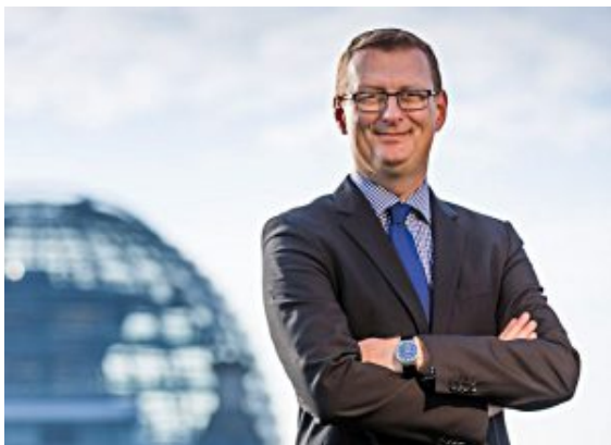
Oliver Kaczmarek, Bundestagsabgeordneter und

Der Vorsitzende der SPD im Kreis Unna und heimische Bundestagsabgeordnete Oliver Kaczmarek wurde auf dem Landesparteitag der SPD Nordrhein-Westfalen am vergangenen Samstag in Bochum erneut in den Landesvorstand gewählt.