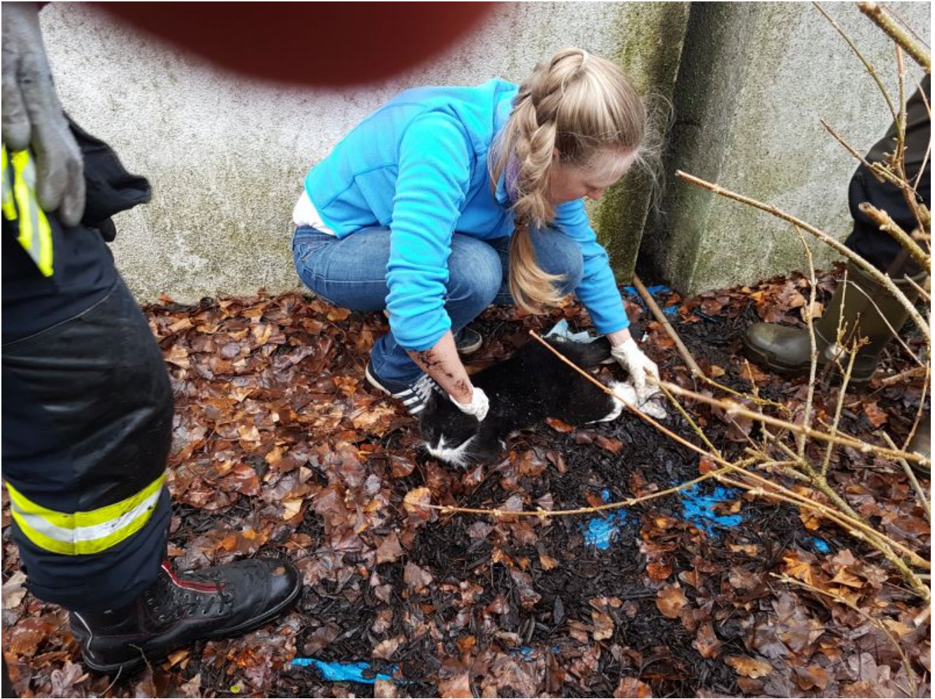
Erste Untersuchung nach der Rettung.