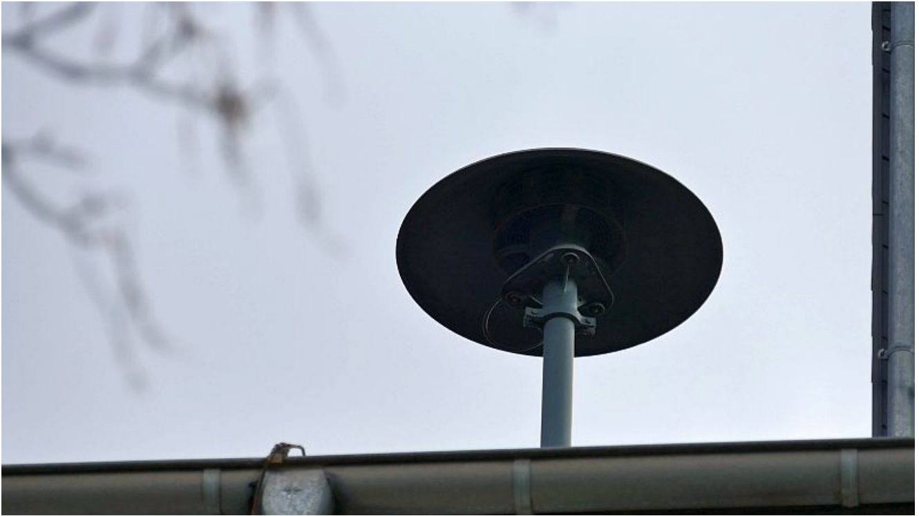
Sirene auf dem „Hochhaus“ in der ECA-Siedlung.

Ein wesentliches Ziel des Sirenenalarms war es aus der Sicht der Feuerwehr, auch die Rettungskräfte zu erreichen, die aus welchen Gründen auch immer weder ihr Smartphones noch den digitalen Funkmelder bei sich tragen. Gleichzeitig sollte es auch eine Warnung sein, dass gleich Feuerwehrleute in ihren Privatfahrzeugen versuchen werden, so schnell es möglich und erlaubt ist, zu den Gerätehäusern zu kommen.