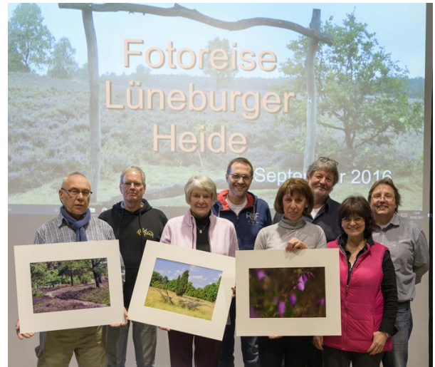
Die TeilnehmerInnen des Fotoworkshops.

Exkursionen zum Wilseder Berg, ins Pietz Moor, in die Ellendorfer Wachholderheide und den Totengrund aber auch ein Ausflug in die Stadt Lüneburg standen auf dem Programm, wobei die Themen Bildgestaltung, Perspektive, Brennweite, Lichtwirkung, Lichtfarbe sowie die angepasste Belichtungssteuerung im Mittelpunkt standen.