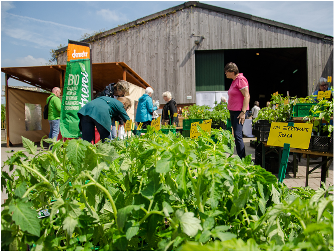
Gemüsepflanzen, so weit das Auge reicht.