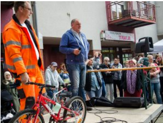
Schnäppchen gab es bei der Versteigerung von Fundsachen.

Da gerieten die Blumen fast zur Nebensache. Zumal es auf dem Nordberg fast an jeder Ecke etwas Spannendes zu entdecken gab. Wo kann man zusätzlich zum frischen Spargel, bunter Verstärkung für den Garten und Leckereien noch ein Klapphandy