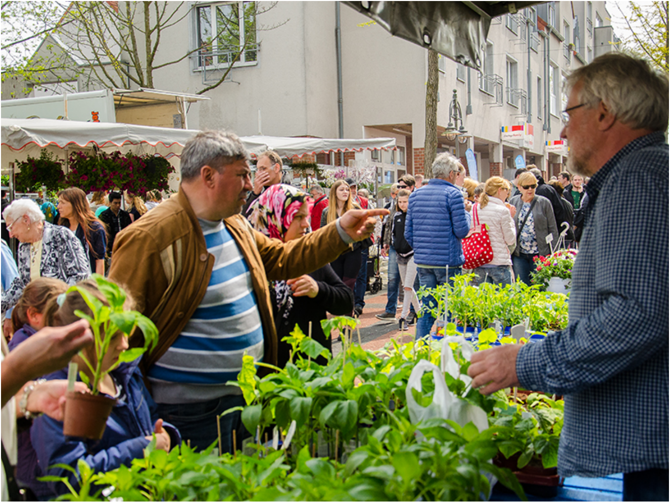
Buntes Treiben bei der Blumenbörse auf der Präsidentenstraße.