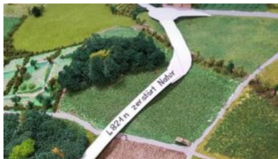
Ausschnitt aus dem Flyer der „BI L821n NEIN“.

Die „BI L821n NEIN“ ruft alle Gegner dieses umstrittenen Straßenbauprojekts auf, an der öffentlichen Ratssitzung am Donnerstag, 11. Oktober, um 17:15 Uhr teilzunehmen. Auf Antrag von BergAUF steht die L 821n auf der Tagesordnung. Dazu haben die Grünen den Antrag gestellt, dass der Stadtrat den Bau ablehnt. Dazu hat die BI L821n Nein folgende Presseerklärung veröffentlicht: