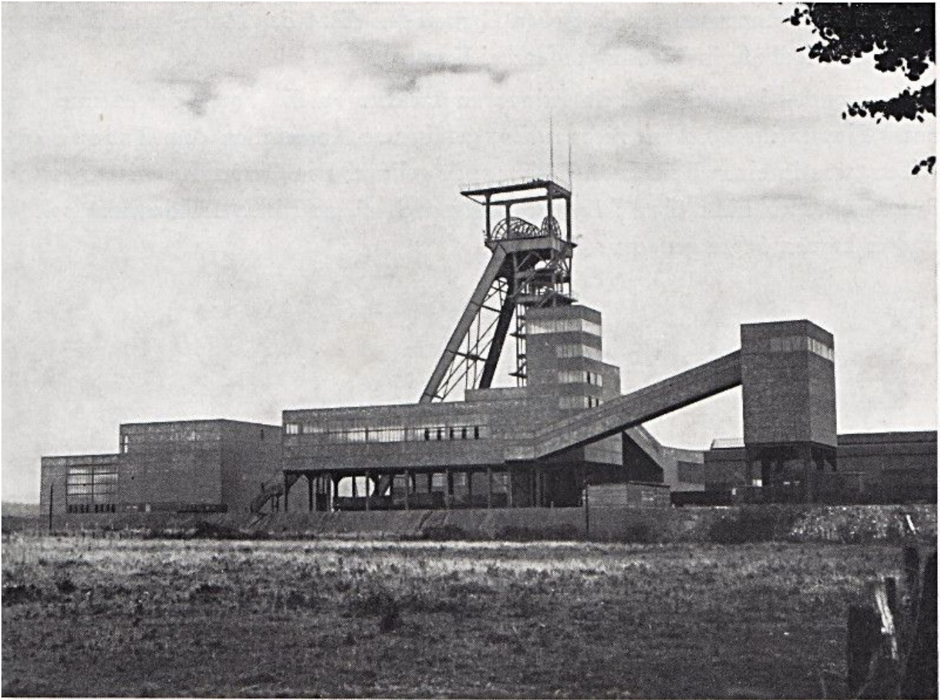
Grimberg 3/4 in den 50er Jahren.