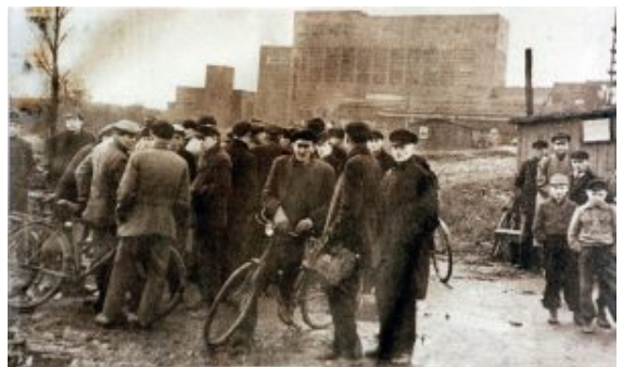
Wartende Menschen vor der Unglückszeche Grimberg 3/4.

Drei Tage nach der Katastrophe wurden acht Überleben gerettet