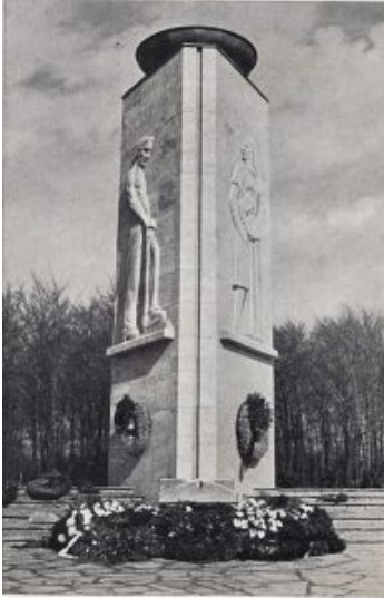
Mahnmal für die Opfer des Grubenunglücks.

Genau sechs Jahre nach dem Unglück wurde am 20. Februar 1952 auf dem damaligen neuen Kommunalfriedhof in Weddinghofen (heute der Waldfriedhof am Südhang) das neun Meter hohe Mahn- und Ehrenmal eingeweiht. Der dreieckige Turm zeigt vorn links einen Bergmann, der sich auf einer Hacke stützt, und vorn rechts eine Bergmannsfrau, die tröstend ihr Kind hält. Auf der dem Wald zugewandten Rückseite sind die Namen aller Todesopfer eingemeißelt worden. Das Denkmal versinnbildlicht den Schachtturm, durch den die Bergleute eines Tages einfuhren und durch ein verheerendes Unglück überrascht wurden. Am Fuß des Turms befindet sich ein Sarkophag mit den Symbolen des Bergmannberufs „Schlägel und Eisen“ mit aufgelegtem Lorbeer.