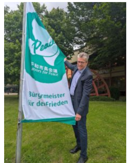
BBürgermeister Bernd Schäfer mit der Mayors for Peace Flagge.