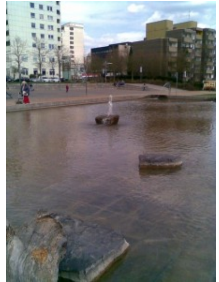
Die Wasserspiele im Wasserpark im Probelauf

So wurde bereits der Springbrunnen am Herbert-Wehner-Platz wieder in Betrieb genommen; nach Prüfung der Wassertechnik erfolgte auch eine Neubepflanzung der Blumenkästen.