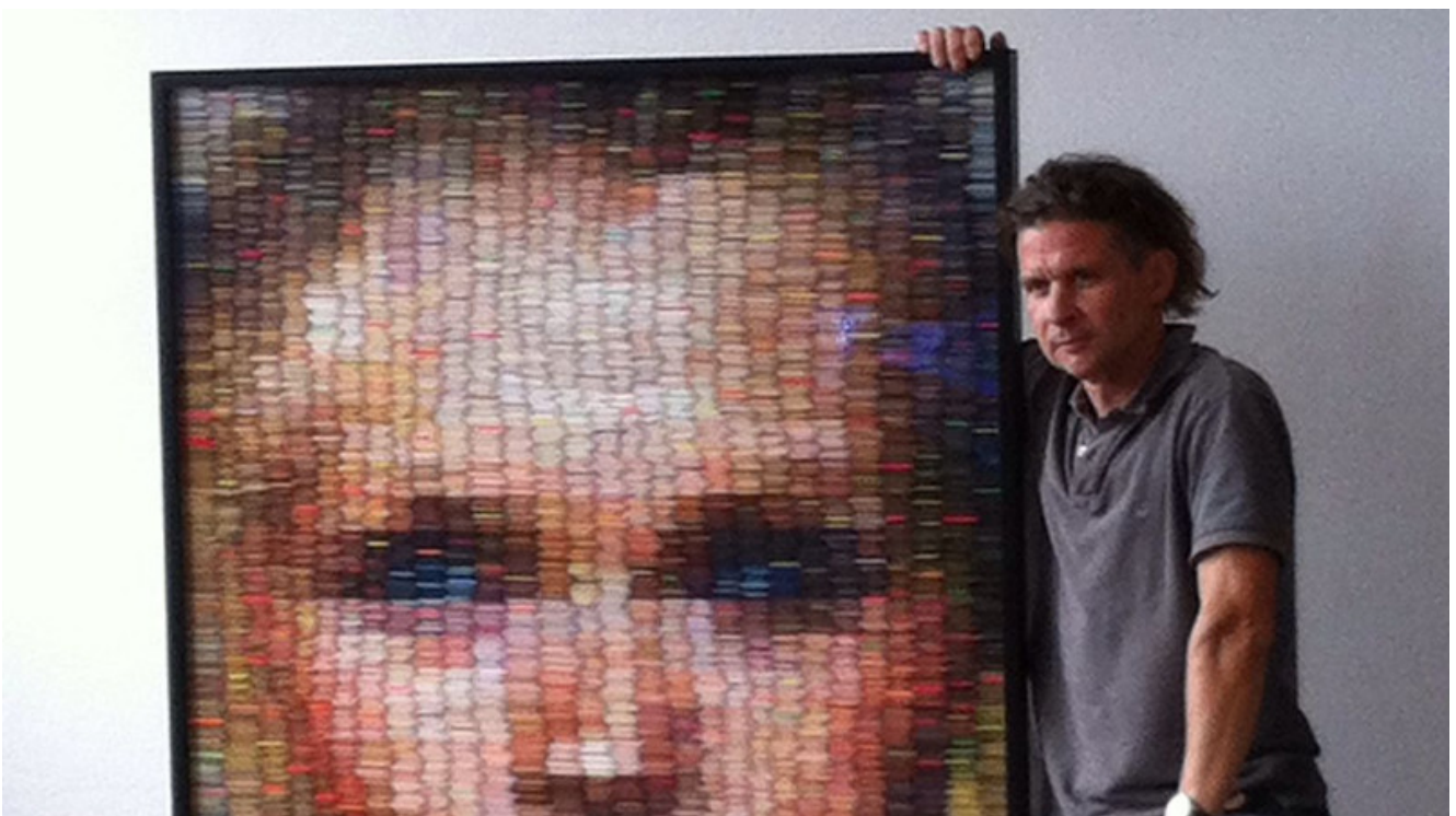
Maxim Wakultschik.