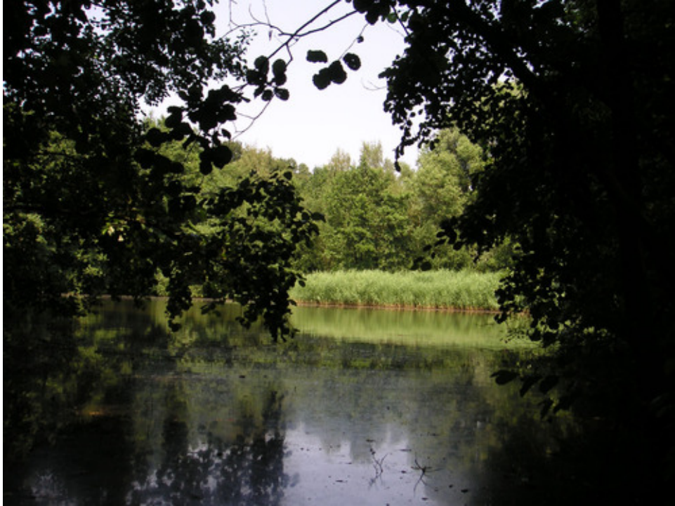
Gewässer im Mühlenbruch.

Am Donnerstag, 30. Mai, findet wieder die traditionelle Familienwanderung des NABU unter der Leitung von Udo Bennemann im Mühlenbruch statt.