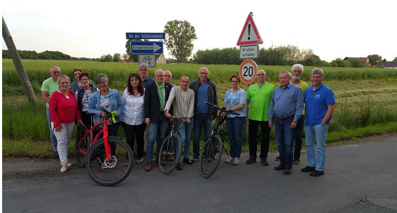
Die neue ADFC-Ortsgruppe Bergkamen.

An der Gründungsveranstaltung der neuen ADFC-Ortsgruppe Bergkamen am Donnerstag in der Schützenheide nahmen 15 Fahrradinteressierte aus Bergkamen teil. Darunter die meisten bereits ADFC-Mitglieder, aber auch Neugierige, die sich einfach für das Radfahren interessieren.