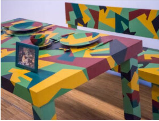
Der Frühstückstisch mit Manet-Anspielung im Tarnanzug.

Angefangen hatte es mit dem Bergkamener Bilderbasar und einem jungen Timm Ulrichs, der gerade seine Professur in Münster begonnen hatte. „Mit einem vorurteilsbeladenen Publikum, mit dem man heftig in den Kneipen über Kunst streiten konnte“. Damals „waren die Mädchen noch hübsch“ und die Inspiration grenzenlos. Anspielungsvoll tarnte er den Frühstückstisch im Grünen mit Wink zur Manet-Idylle im militärischen Outfit – als Abstraktion und Konkretion. Parallel dazu war der Globus auf Plakaten im Tarnanzug präsent. Denn da die Gottsuche längst aufgegeben worden war, musste man sich umgekehrt psychologisch kriegsgerecht wenigstens vor Angriffen aus dem All schützen.