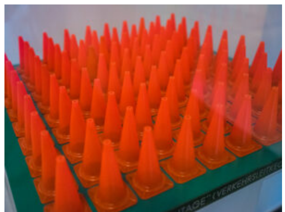
Verkehrsleitkegel als Kunst im Modell.