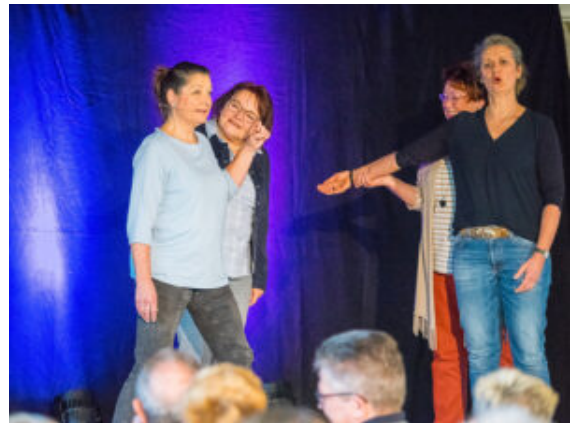
Lebendiges Puppentheater auf der Bühne.

Damit überhaupt noch Hoffnung aufkeimt, braucht es extrem gute Stimmung. Dafür sorgten das quirlige Damen-Doppel Piplies & LaMinga „Zum Glück lustig“. Heiter ging es von der männlichen Internet-Welt mit Rasentrimmer und Dackel-Liebe inklusive Befruchtung und Puffmutter-Auswechslung direkt in die Kita dank abstruser Situationskomik aus dem Zettel-Kasten mit täglichen klugen Weisheiten. Das Publikum durfte sich wünschen, wo die Frauen einkaufen gingen und schickte sie von der Buchhandlung zu den „hebenden und teilenden“ Angeboten im Miederwarengeschäft, Tieren aus dem Zooladen, „die was hermachen“, vielen schicken Büchern mit Bildern und Leuchtendem „auch für untenrum“ aus dem Erotikfachmarkt.